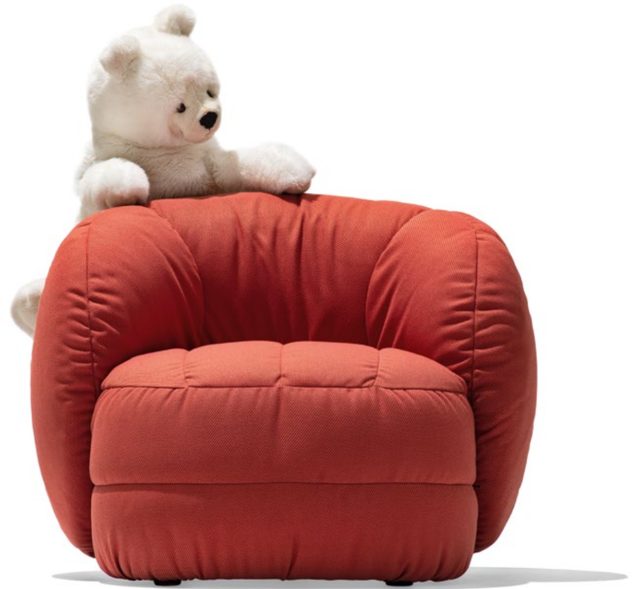
Reef CB3441 sedia lounge | tessuto Oceanic SUX zafferano lounge chair | Oceanic fabric SUX saffron yellow