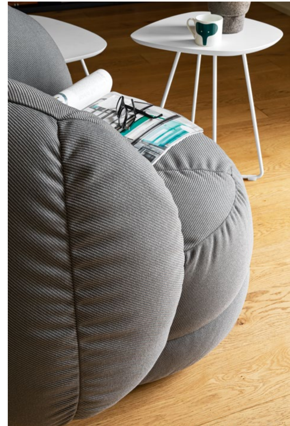
Reef CB3441 sedia lounge | tessuto Oceanic SUT tortora - lounge chair | Oceanic fabric SUT taupe Ciop CB5225-G - CB5225-P tavolini fissi | metallo P94 bianco ottico opaco / laccato P94 bianco ottico opaco - coffee tables | metal P94 matt optic white / lacquered P94 matt optic white