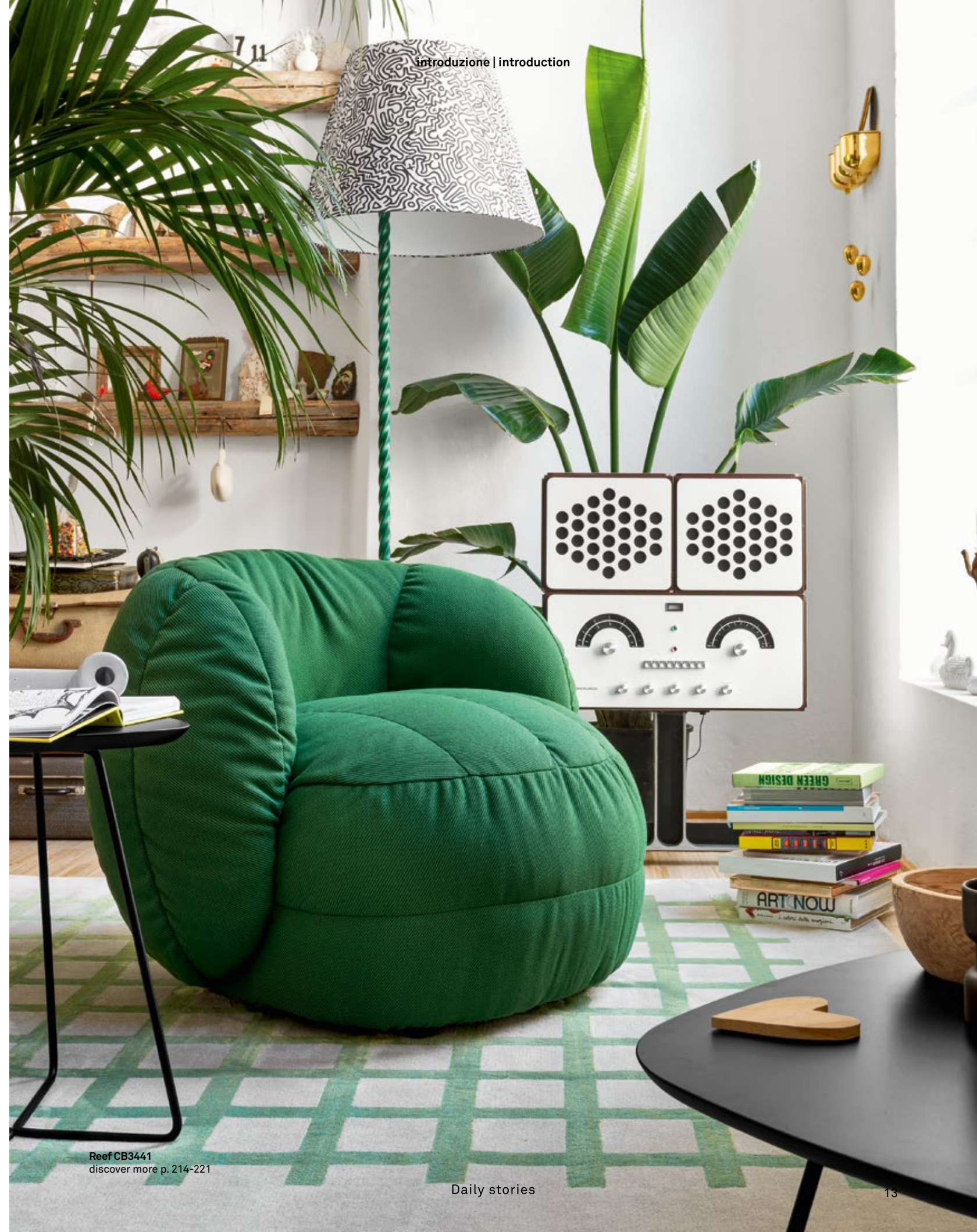
Reef CB3441 discover more p. 214-221